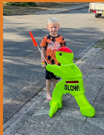
Deze jonge bewoner van de Schoolstraat is maar wat blij met Victor Veilig!