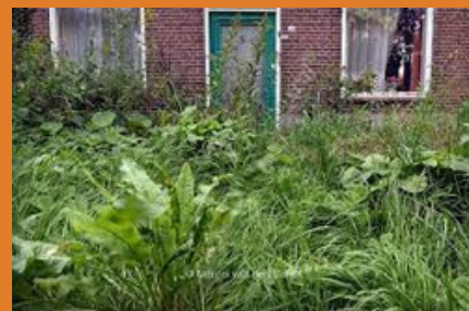
Een verwaarloosde tuin is een doorn in het oog van buurtbewoners

Op woensdag 28 en donderdag 29 september voeren wij een extra ronde met borstel- en veegwagens uit om onkruid te verwijderen. Dit gebeurt in twee dagen. Hierbij wordt eerst de ene helft en de volgende dag de andere helft van de wijk aangepakt. De borstelwagen kan het onkruid alleen verwijderen op plekken waar geen auto's staan. We willen u dan ook vragen op deze dag uw auto te verplaatsen.